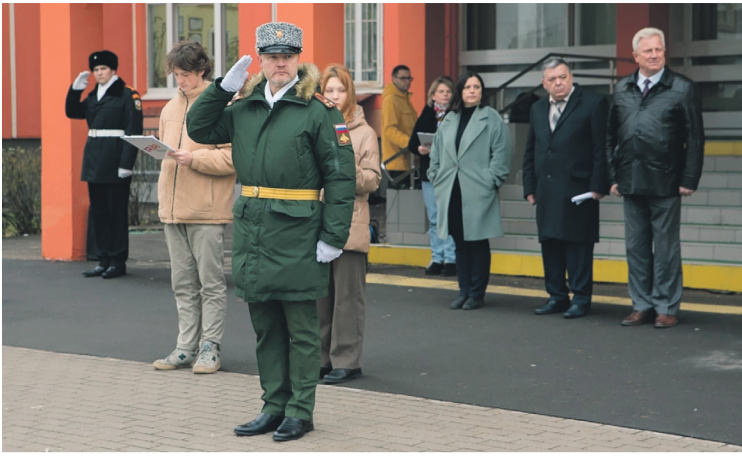
8 ноября в ГБОУ Школа №1238 состоялся «Торжественный кадетский марш», посвященный легендарному военному параду 7 ноября 1941 года.

Мероприятие началось с торжественного выноса знамени: Знамени Победы, знамени кадетского образования школы №1238 и Государственного флага Российской Федерации под командованием полковника запаса, офицера-воспи-