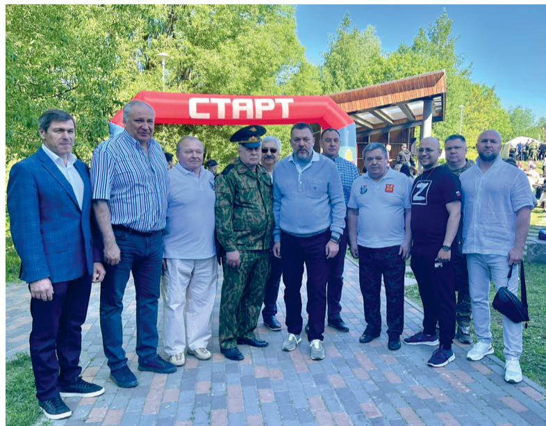
25 мая в нашем районе прошли военно-патриотические соревнования «Тропа БОЕВОГО БРАТСТВА» (московский этап) и «Западная стража. Тропа кадетов».

ГАЗЕТА МЕСТНОГО САМОУПРАВЛЕНИЯ МУНИЦИПАЛЬНОГО ОКРУГА НОВО-ПЕРЕДЕЛКИНО В ГОРОДЕ МОСКВЕ